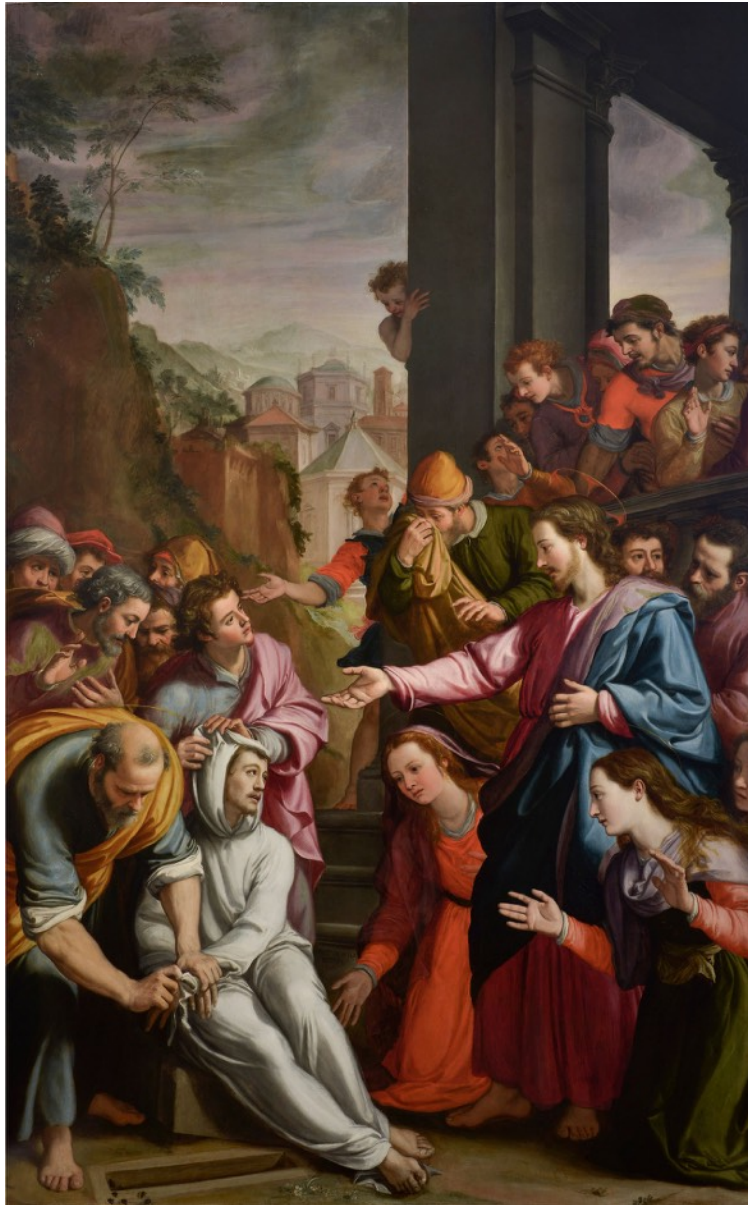
Johannes 11:1-17 - Opwekking van Lazarus Santi di Tito, 1576 Santa Maria Novella, Florence